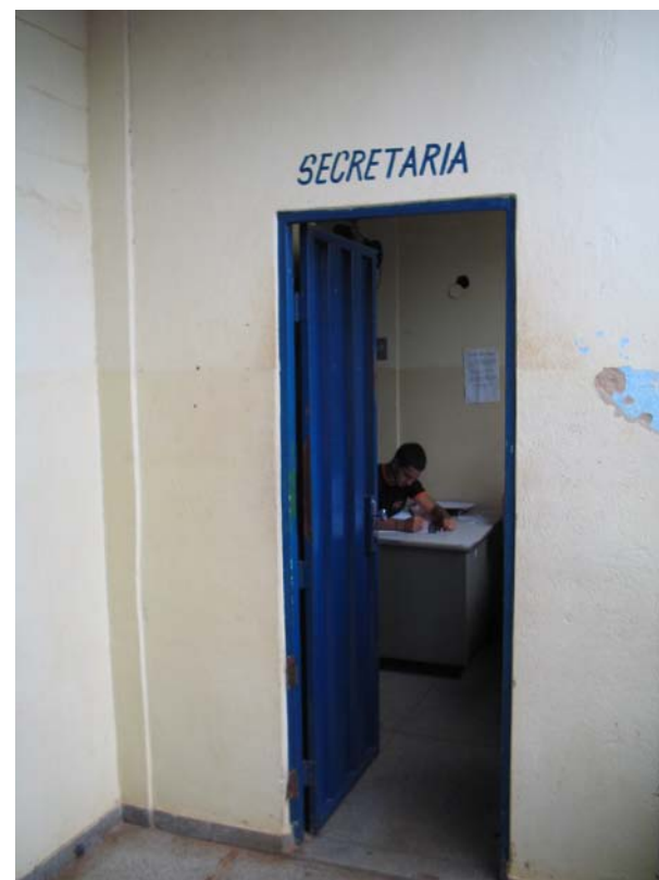
Figura sete: Secretaria