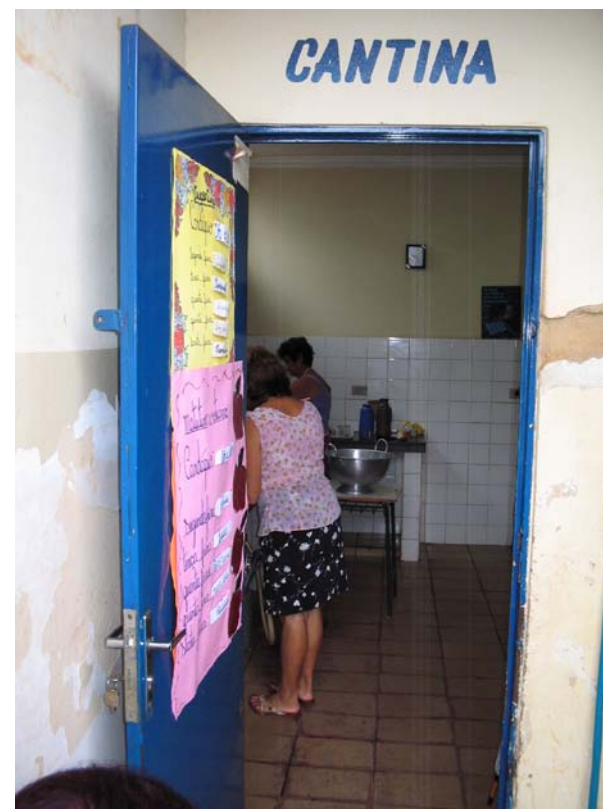
Figura nove: Cantina

Geralmente, não se notam, nas paredes dos corredores, trabalhos pedagógicos que revelam as aprendizagens dos alunos. O que se vê são cartazes anunciando cursos diversos, promoções comerciais do setor ou divulgação de eventos educacionais. Mas pode-se ler, em diversas placas de material acrílico afixadas por toda Escola-Campo, enunciados que se referem ao Plano de Desenvolvimento da Escola - PDE: sua Visão de Futuro; sua Missão; seus Valores; o Sucesso da Gestão. Sinteticamente, esses princípios deveriam orientar a qualidade do ensino oferecido pela Escola-Campo, por meio da formação do cidadão crítico e participativo, e do compromisso, da transparência e da integração entre a escola e a comunidade.