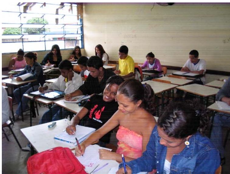
Figura dez: Sala D