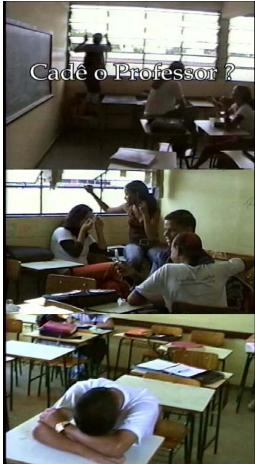
Figura treze: cenas do filme 'Cadê o professor?'