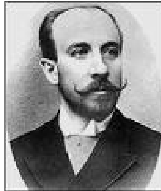
Figura dois: George Méliès

Contemporâneo dos irmãos Lumière, Méliès, fascinado pela nova engenhoca, entusiasmou-se com a possibilidade de incluí-la em seus shows de variedades, prestidigitação e ilusionismo. Estudou alguns aparelhos até então existentes, compreendeu os mecanismos de registro e projeção da imagem em movimento, desenhou e construiu seu próprio cinematógrafo, no qual aliava as duas funções, capturar e projetar em um único equipamento.