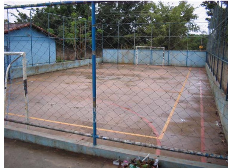
Figura quatro: Quadra de esportes

A biblioteca é a maior sala da escola. Apesar de clara e ventilada, também é precária, consistindo-se de um espaço ocupado por um amontoado de mesas e cadeiras de estrutura desigual e algumas prateleiras rústicas. Parecem ser equipamentos retirados das sucatas existentes na escola, ou que sobraram das salas de aula.