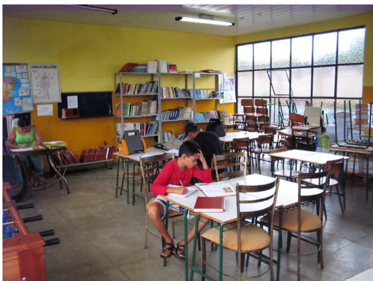
Figura cinco: Biblioteca