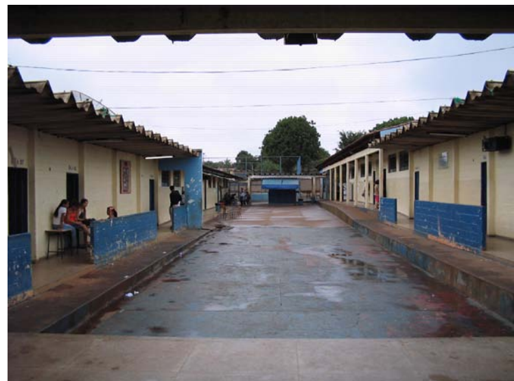
Figura três: Pátio

Além de ser arena e palco das relações sociais, o pátio é um ambiente que permite vislumbrar o céu, que possibilita receber diretamente os raios do sol, perceber a brisa da noite e avistar as copas das árvores que circundam a escola pelo lado de fora. É confidente e espectador das diversas relações que nele são vivenciadas: sonhos, desejos, afetos, frustrações são constantemente compartilhados pelos estudantes ali. No entanto, quase nunca tem sido utilizado para desdobramentos de atividades pedagógicas ou como espaço para promoção de