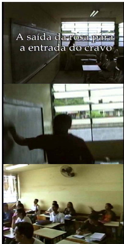
Figura quatorze: cenas do filme 'A saída da rosa e entrada do Cravo'

Fonte: Filme 'A saída da rosa e entrada do Cravo'