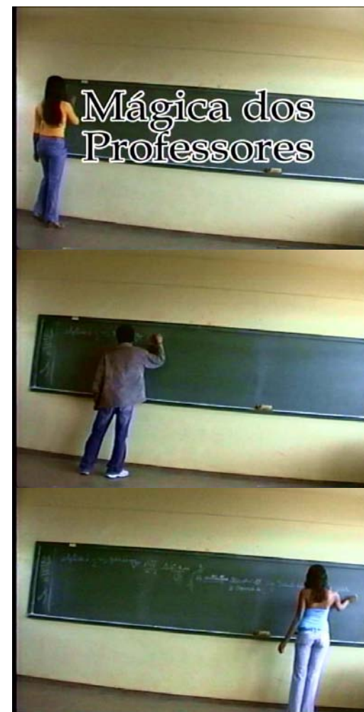
Figura dezesseis: cenas do filme ‘ A mágica dos professores ’.

O roteiro de ficção dos estudantes se orientou pela constante mágica de substituir, em cena, os professores. Com enquadramento fixo no quadro-giz, os docentes encontravam-se de costas para a câmera, para a