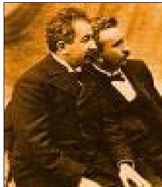
Figura um: Irmão Lumière

É sabido que os irmãos Lumière eram dotados de sagacidade e curiosidade, características que os impulsionaram a estudar os aparelhos que de uma maneira precária, lidavam com um tipo de imagem em movimento. Sendo assim, inventaram o cinematógrafo, um aparelho que possibilitou um modo de documentar e eternizar instantes da vida quotidiana, bem como dos acontecimentos públicos notórios. Por intermédio dessa invenção foi possível registrar o movimento do vento sobre as folhas, as ondas do mar, a fumaça na lareira, as brincadeiras infantis no parque, os conflitos emocionais humanos materializados em brigas, guerras, mortes, o triunfo dos governantes ao serem empossados. É indiscutível: esses inventores deixaram, como legado para o século XX, uma máquina que mudou a memória coletiva, a documentação e informação, a arte e o entretenimento.