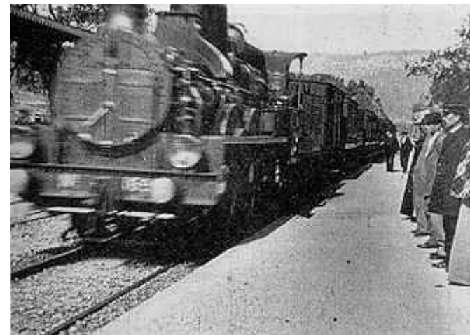
Figura doze: cenas do filme ‘A chegada do trem na Estação Ciotat’ .

Todos esses filmes foram vistos e comentados em sala de aula. Em todas as sessões, eu chamava a atenção para que os estudantes observassem