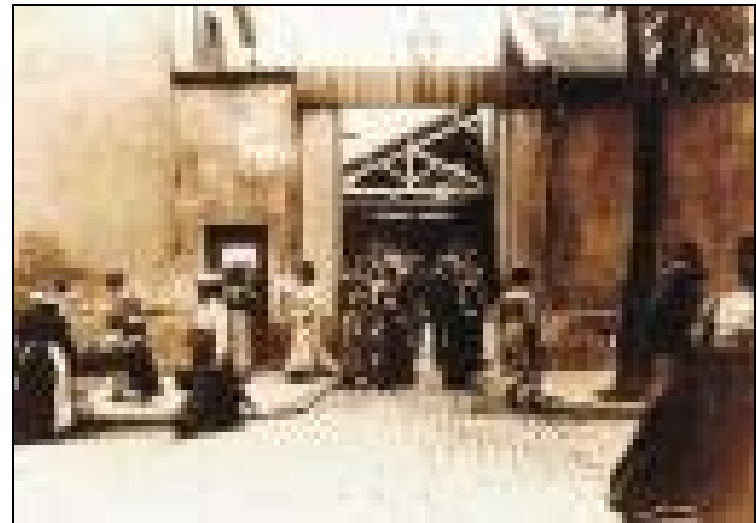
Figura onze: Cenas do filme ‘ a saída dos operários da fábrica ’

Como o cinematógrafo foi colocado no outro lado da rua, defronte aos portões da fábrica, foi possível, mais uma vez, verificar os desejos, os valores e as concepções de representação configuradas pelos irmãos Lumière, que não buscavam construir cenários, mais sim