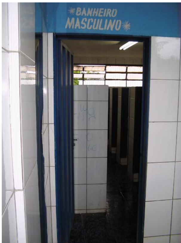
Figura seis: Banheiro Masculino