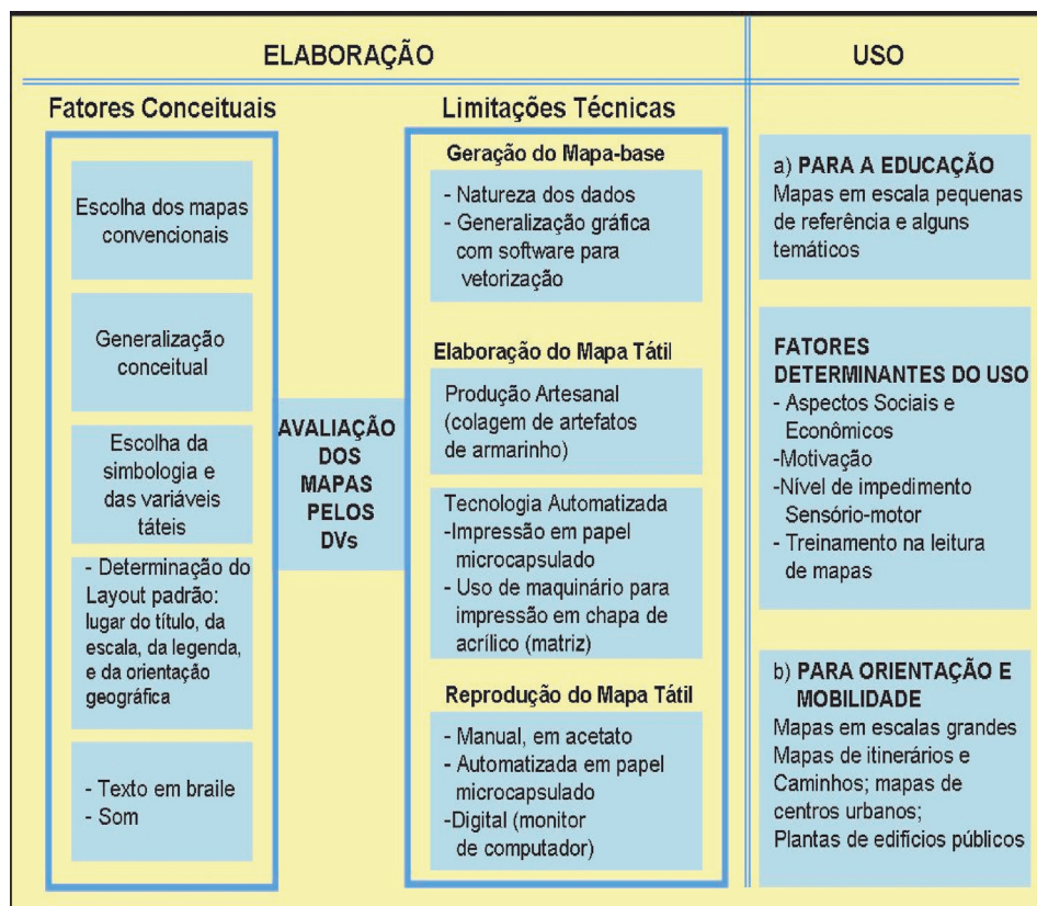
Quadro 1 - A elaboração e uso de mapas táteis