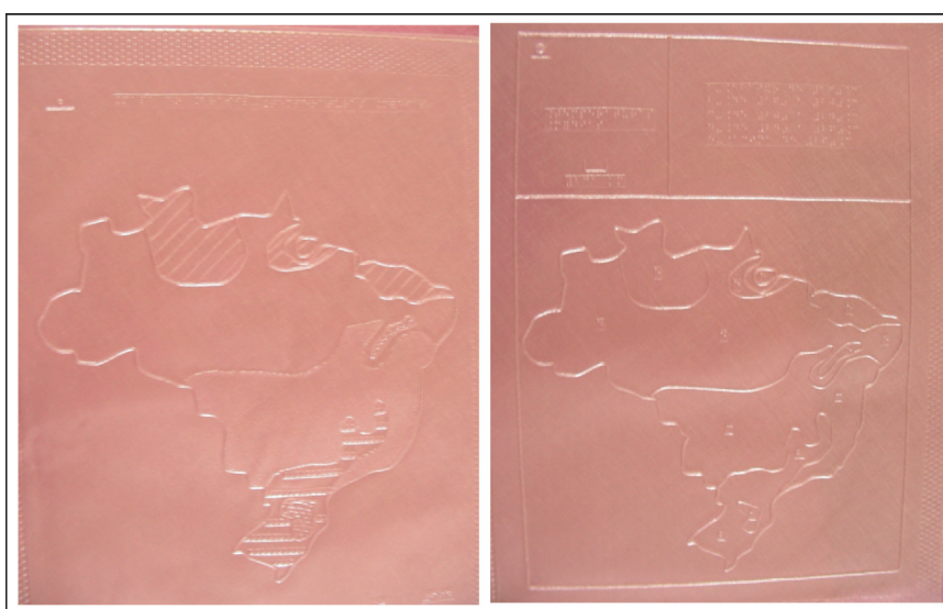
Figura 2 – Um mesmo mapa tátil elaborado com variáveis táteis e sem estas.

Os mapas e plantas em escala muito grande com a função de auxiliar na orientação e mobilidade, ao contrário de mapas para a educação, utilizam pouca simbologia quando se trata dos mapas convencionais. No entanto, para esses tipos de mapas na versão tátil, é necessário incorporar simbologias principalmente pontuais para marcar lugares importantes para a locomoção e orientação no espaço de interesse, sejam eles um edifício público, ou um centro urbano.