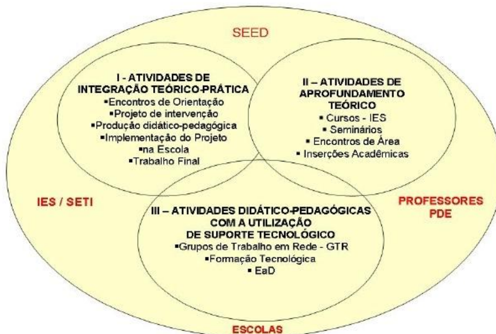
Figura 1 - Quadro Esquemático do Plano Integrado de Formação Continuada PDE/PR

na figura 1: I- Atividades de Integração Teórico-Prática; II- Atividades de Aprofundamento Teórico; III- Atividades Didático-Pedagógicas com a utilização de suporte tecnológico.