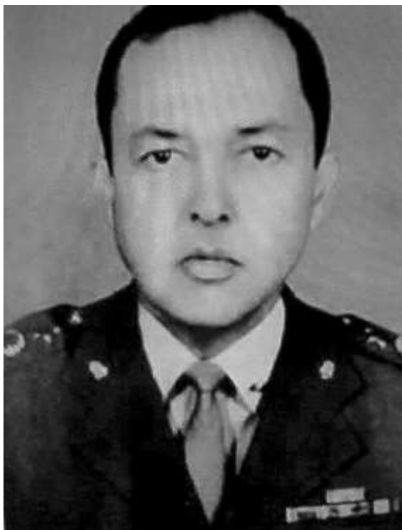
Figura 4 - Coronel Waldyr Coelho

O tenente-coronel Waldyr Coelho comandou a OBAN e o DOI-CODI paulista no biênio 1969/1970. Porém, desentendimentos com o delegado Sérgio Paranhos Fleury 226 levaram-no a ser substituído pelo então major Carlos Alberto Brilhante Ustra. Transferido inicialmente para a chefia da seção de informações da 2ª Divisão de Infantaria, logo a seguir, Waldyr Coelho assumiu o comando do 2º Batalhão de Engenharia de Combate – BEC – de Pindamonhangaba – SP, onde ficou de 1971 à 1974.