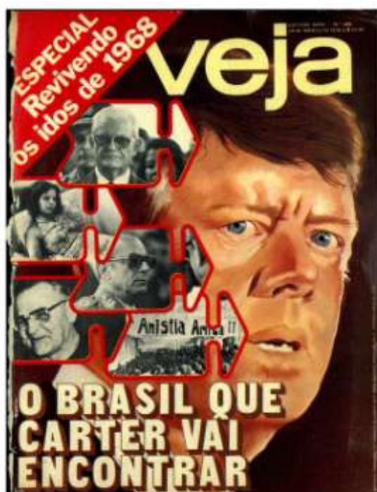
Figura 3 - Revista Veja: 29 de março de 1978.

A utilização dos periódicos permitiu não somente o alargamento do número de fontes, mas também a possibilidade de verificar e conhecer, entre outros aspectos, as transformações que abrangem as práticas culturais, os comportamentos sociais e as manifestações ideológicas de uma determinada época. Sobre a opção pelo uso desse tipo de fonte na pesquisa historiográfica, observa Luca