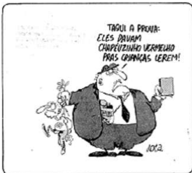
Figura 1 - Paraná: professores acusados de dar aulas de marxismo a crianças de 3 a 6 anos. Folha de S. Paulo, São Paulo, 02 de abril de 1978, folhetim, p. 14.

divide. No caso em tela, é preciso reconhecermos, para a satisfação dos detratores da esquerda, que os nomeados “onze de Curitiba”, realmente, só se uniram na cadeia.