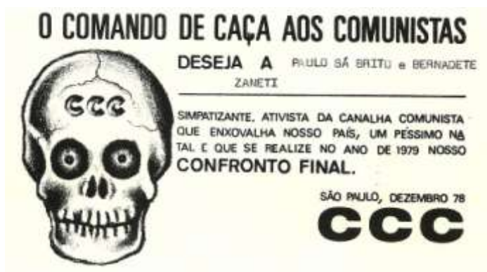
Figura 2 - Cartão de natal enviado pelo CCC.

A própria Operação Pequeno Príncipe com suas prisões, invasões de residências, apreensões de objetos pessoais, intermináveis interrogatórios, exposições midiáticas, privação contínua da liberdade e as torturas psicológicas, significou a imposição de inúmeras situações de humilhação para os atingidos.