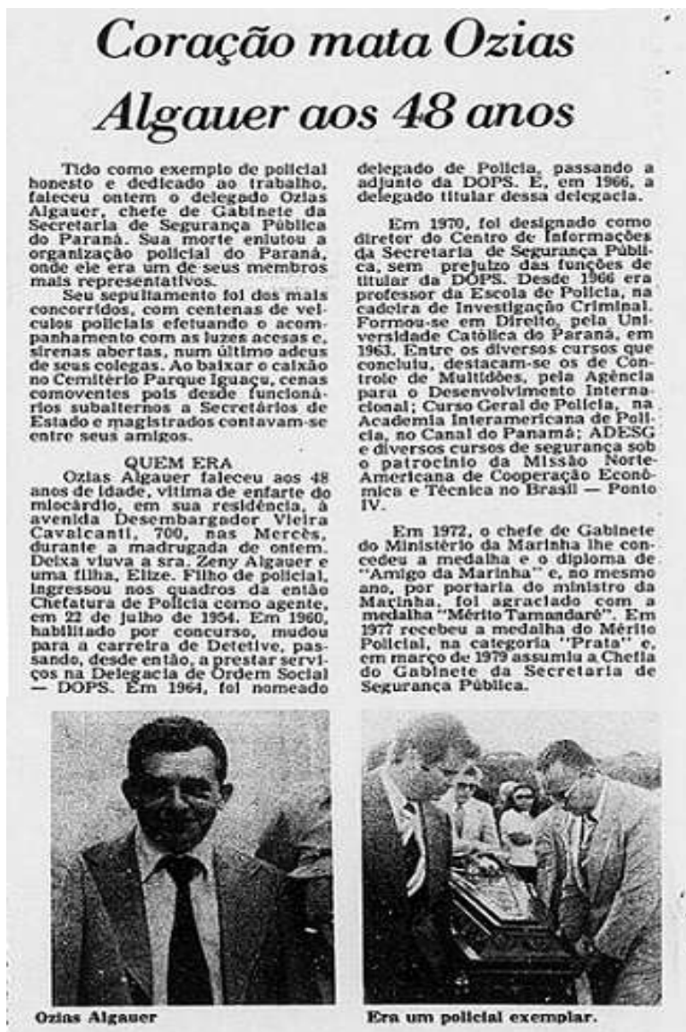
Figura 7 - Matéria do jornal O Diário do Paraná, por ocasião da morte de Ozias Algauer, 11/04/1980, p. 6.

Ozias Algauer, como afirmou em entrevista o delegado Roberto Monteiro, da PF, era um ativista da área de operações da polícia política e na segunda metade dos anos de 1970, já possuía uma larga experiência na perseguição aos subversivos paranaenses. Quando de seu falecimento em 1980, reportagem do jornal Gazeta do Povo, publicada em 11 de abril, apresentou um breve histórico da carreira do temido chefe da DOPS no período mais ácido da repressão no Paraná: