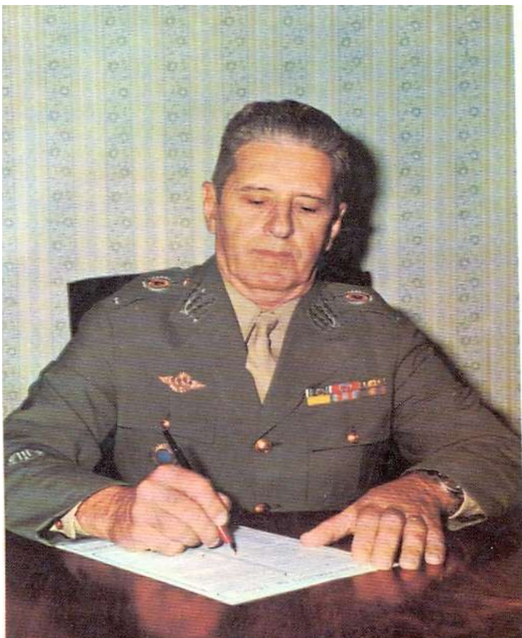
Figura 6 - General Ferdinando de Carvalho.

O coronel Ferdinando de Carvalho 233 , foi designado responsável entre os anos de 1964 e 1966, pela condução do famoso IPM-709, Inquérito Policial Militar instaurado para investigar as atividades do Partido Comunista Brasileiro – PCB. Auxiliado por outros 20 oficiais, Carvalho pretendeu, através desse IPM, incriminar Negrão de Lima, governador eleito da Guanabara, no pleito de 1965, acusando-o de compactuar com os comunistas, o que justificaria a cassação de seus direitos políticos. Segundo aponta a obra Brasil nunca mais , esse famoso IPM, presidido por Carvalho, no estado do Rio de Janeiro, em 1964: