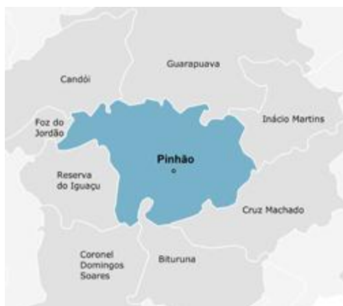
Mapa 6

Na Casa Familiar de Santa Maria do Oeste, foram entrevistados dez jovens egressos do curso técnico em agropecuária. As idades variam entre 18 a 22 anos. As entrevistas ocorreram nas propriedades rurais e nos locais de trabalho, empresas agropecuárias. Todos moram nas propriedades rurais, porque este é um dos critérios base para a seleção dos jovens: que sejam filhos de agricultores.