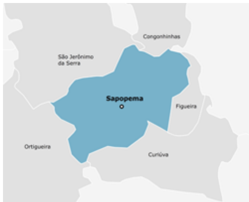
Mapa 4

O município de Pinhão tem 30.208 habitantes, sendo que 14.317 estão no campo, ou seja, quase 50% da população. A Casa atende a oito municípios da região que também são de baixa densidade populacional. Os jovens são oriundos de pequenas propriedades rurais e as principais atividades da região são: agricultura, horticultura, fruticultura, aveia, batata inglesa, cevada, feijão, erva-mate e agricultura de subsistência, e também há gado de corte e leite, galináceos, ovinos e suínos.