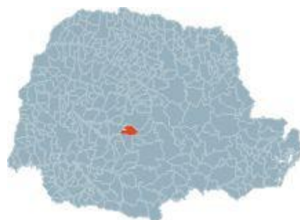
Mapa 1