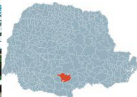
Mapa 5 - Fonte: IPARDES.