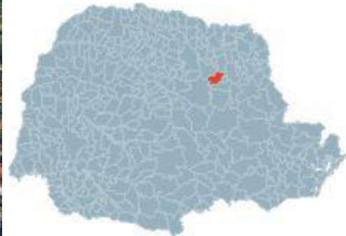
Mapa 3 -Fonte: IPARDES.