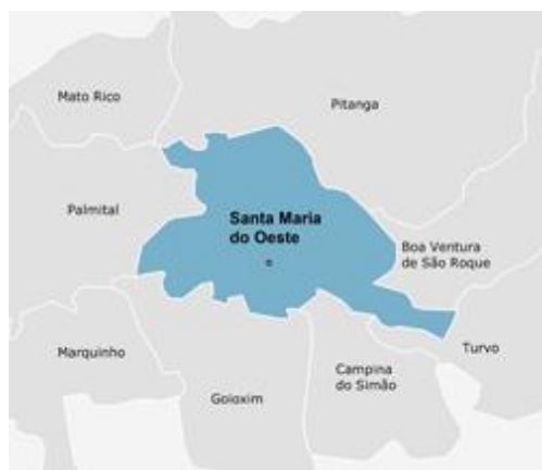
Mapa 2-Fonte: IPARDES, Base Cartográfica ITCG (2010)

O município de Sapopema tem 6.736 habitantes. Destes, 3.184 residem no campo - logo em torno de 50%. Sua Casa Familiar tem abrangência em cinco municípios. Uma das suas características é a grande concentração de assentamentos rurais da reforma agrária, originários do Movimento Sem Terra (MST). A organização da Casa é bastante sintonizada