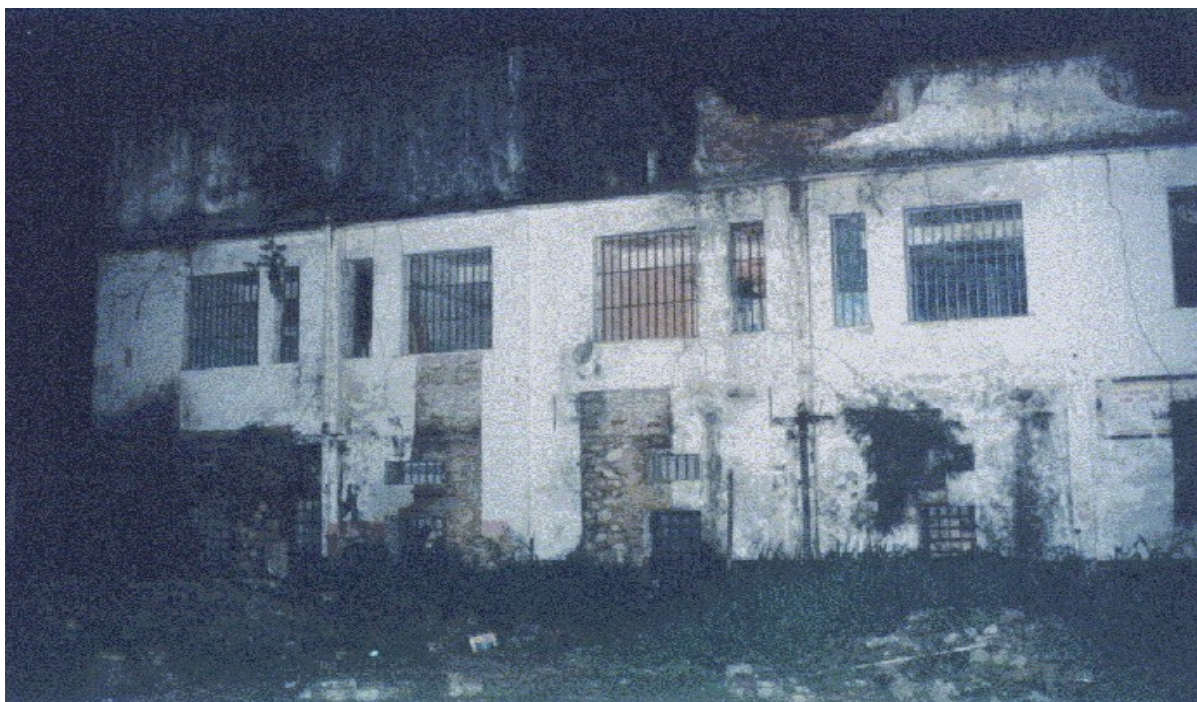
Foto do Acervo do ACC – Atividade Curricular em Comunidade intitulada Ensino e Pesquisa na Roda de Capoeira 114 , 2003 (RELATÓRIO TÉCNICO CIENTIFICO, 2003-A, anexos)

Veja, a seguir, fotos do antes e depois da referida reforma