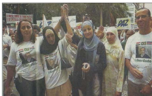
FIGURAS 15 e 16: Mulheres muçulmanas na passeata pela liberdade do engenheiro juizforano seqüestrado no Iraque (Folha de São Paulo, 30/01/2005, p. A 18)