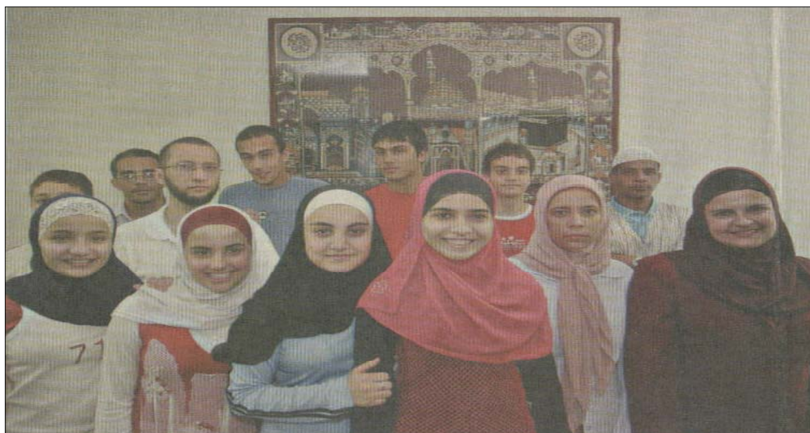
FIGURA 14: no primeiro plano, mulheres da SBMJF (Panorama, 4/01/2004, p.1)

Atualmente, fazem parte da Comunidade Muçulmana de Juiz de Fora cerca de vinte e cinco mulheres entre adultas e crianças.