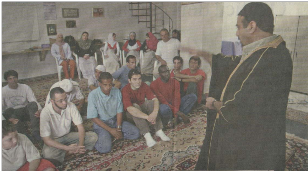
FIGURA 12: interior da SBMJ (Panorama, 4/01/2004, p. 10).