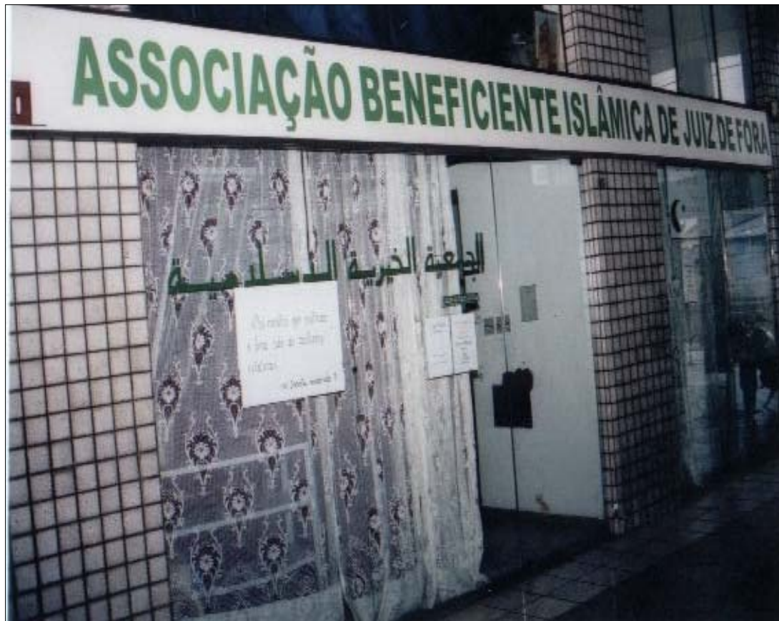
FIGURA 11: exterior da SBMJF.