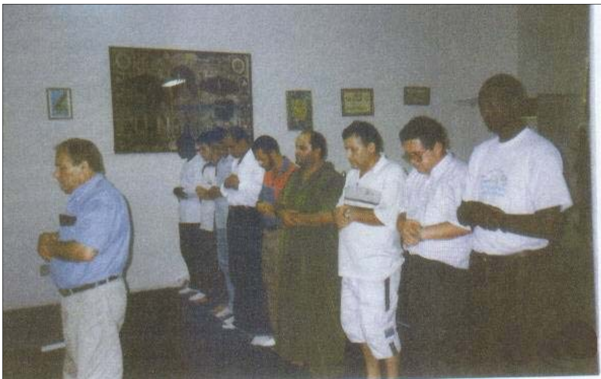
FIGURA 9: Oração Congregacional dos muçulmanos de Juiz de Fora em sua antiga sala usada para encontros.