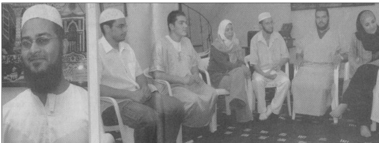
FIGURA 13: a esquerda, šayh da mesquita de Juiz de Fora (Tribuna de Minas, 13/11/2004, p. 6)

Em Juiz de Fora, um convertido foi enviado para o Sudão com a finalidade de aprender a língua árabe e fazer um curso em um Instituto de Ciências Islâmicas. Receberam um financiamento internacional para as passagens e o instituto sudanês fornece livros, alojamento e alimentação. Esses enviados são ‘convertidos’, ou seja, não são filhos de imigrantes. Toda essa movimentação para preparar especialistas da religião muçulmana parece ter em vista a população brasileira e seu potencial de conversão.