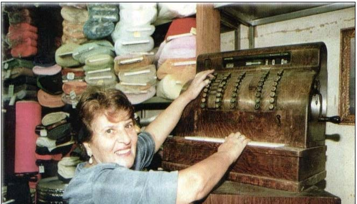
FIGURA 6: Loja de tecidos de propriedade de árabes, situada no centro da cidade de Juiz de Fora (encarte do Jornal Tribuna de Minas, 31/05/2000, p. 41).

Em Juiz de Fora, chamam atenção atualmente, os traços deixados pelos primeiros imigrantes árabes, como as lojas de tecidos, os restaurantes típicos e as várias malharias de proprietários árabes.