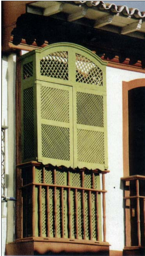
FIGURA 2: Casa do Muxarabiê – Diamantina/MG.

o muxarabiê, espécie de balcão inteiramente fechado por treliças, que permitiam às mulheres verem o movimento das ruas no período colonial brasileiro sem serem vistas.