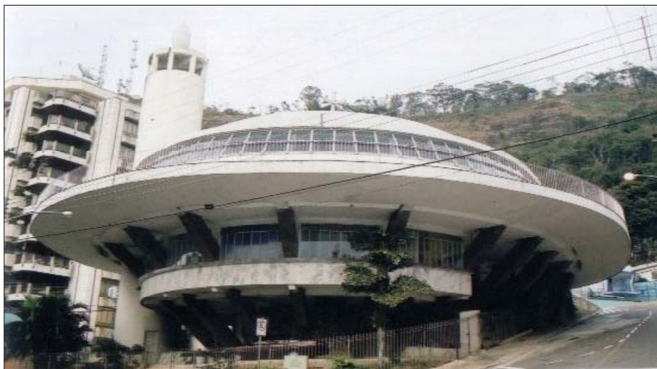
FIGURA 3: Paróquia Melquita Católica de São Jorge.

barraquinhas e comidas típicas árabes nas ruas próximas à Igreja Melquita. A renda é aplicada em obras sociais. 47