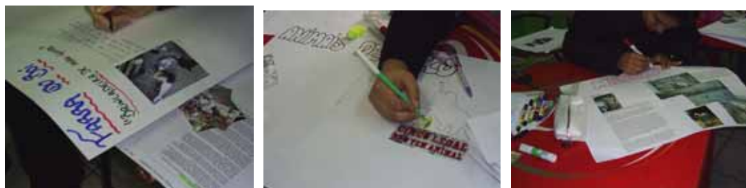
Figura 1: Grupos desenvolvendo seus cartazes, utilizando desenhos de sua própria elaboração.

4º Encontro -06/07/2009: Os alunos organizaram-se em seus grupos com seus respectivos materiais. Na proposta de trabalho, cada grupo deveria confeccionar cartazes sobre os assuntos escolhidos e um folder que representasse de maneira clara o ponto de vista dos integrantes do grupo sobre o assunto abordado. Todos mostraram-se muito receptivos quanto à proposta e iniciaram as discussões, a separação dos materiais e a organização dos cartazes. O início do trabalho de elaboração dos cartazes foi fotografado, assim como o produto final, para que fosse feito um acompanhamento do desenvolvimento das atividades e do empenho dos grupos.