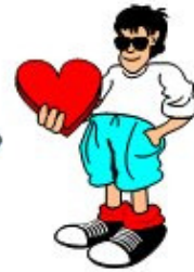
Figura 1. Ejemplo de “declaración de amor” (ABIO y BARANDELA, 1997).

El problema se complica porque la frase “(yo) gusto de él (o de ella)”, o su forma negativa “yo (no) gusto (de él) (o de ella)”, así mismo, con la presencia de la preposición “de”, es una expresión de atracción por otra persona que se puede encontrar también, y principalmente, en el habla de los jóvenes de algunas regiones (ver Fig. 2), pero que en realidad es mucho menos frecuente que la expresión “me gusta él (o ella)” usada con propósitos similares y ya vista anteriormente.