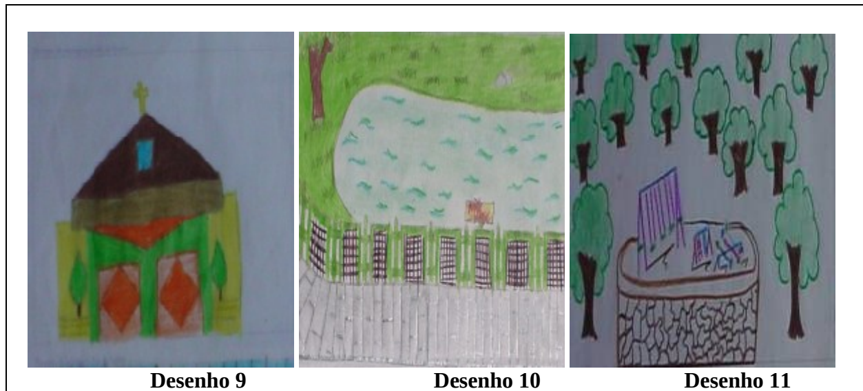
Figura 4: Desenhos representando a paisagem topofílica do bairro

Com relação à paisagem topofóbica do bairro, os alunos identificaram as ações do homem como fator de degradação, tanto no ambiente construído como no ambiente natural. As representações que surgiram foram: vegetação degradada, pichação, lixo, rua e rio. No entanto, houve algumas diferenciações, como mostram os parágrafos seguintes.