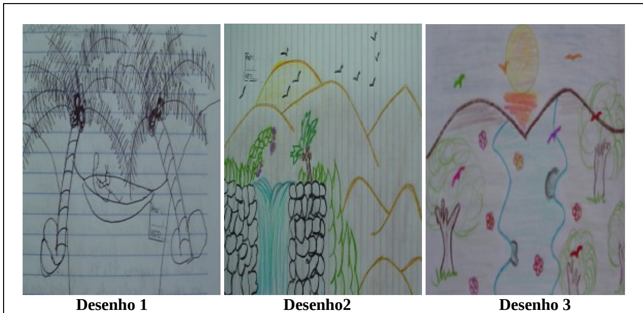
Figura 1: Desenhos da representação da “paisagem”