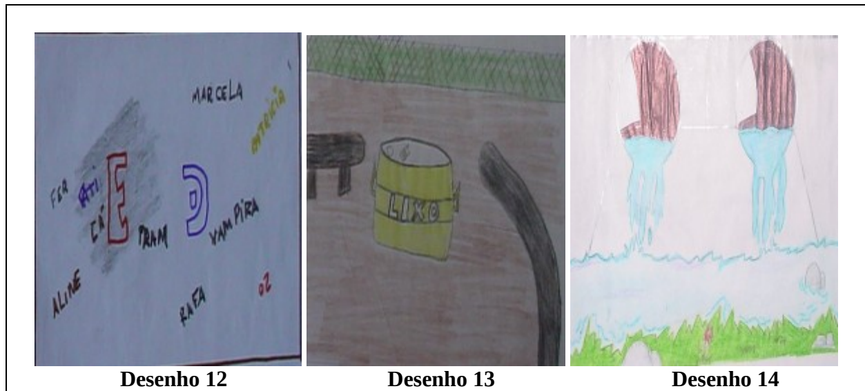
Figura 5: Desenhos representando a paisagem topofóbica do bairro

evocou suas lembranças e desenharam como “paisagem feia” o fundo do vale, com o rio e o esgoto, como ilustra o desenho 14 (Figura 5).