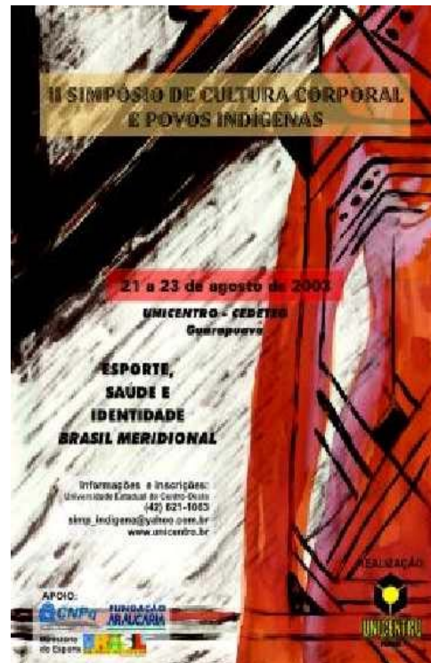
Cartaz do II Simpósio de Cultura Corporal E Povos Indígenas do Brasil Meridional (arte: Nara Gorski)

E no caso Kaingang, a partir de nosso trabalho de campo, veremos agora como o processo de mimesis do esporte - pela via do Futebol - encontrou acolhida e transformação, re-significando-o em uma segunda natureza etno-desportiva.