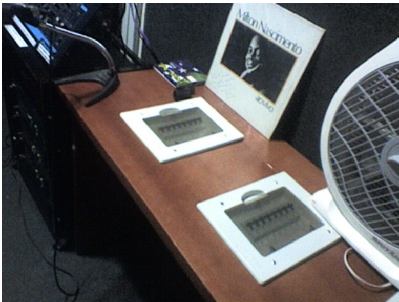
Ilustração 2 – Foto dos interruptores utilizados para ativar e desativar os alto-falantes nas salas de aula.