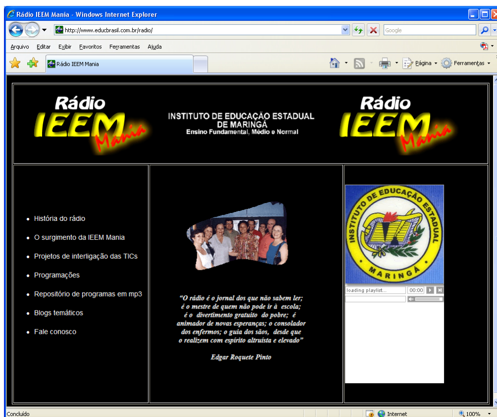
Ilustração 4 – Imagem capturada do site elaborado como proposta para a Rádio IEEM Mania na internet.